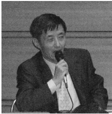
金 觀 濤 (JIN Guantao)

香港中文大学中国文化研究所当代中国文化研究中心主任、香港中文大学中国文化研究所高级研究员