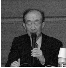
沟口雄三 (MIZOGUCHI Yuzo)