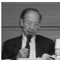
Gregory C. CHOW

Professor of Economics and Class of 1913 Professor of Political Economy, Emeritus, Princeton University