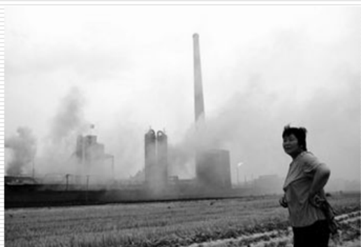
吕梁市郊外的炼焦厂，仅幸剩有700户人家的小高家沟村。2007年1月

这里搜集了一些照片，主要是 2003 年、2004 年以后拍下的。为什么强调这一点？中国急速加大了环境治理的力度。但尽管如此，我们仍然能够看到这种触目惊心的画面。这是吕梁市郊外的一个大型的炼焦厂，旁边有一个 700 多户人家的村庄。这是山西南部的一条河流，涑水河，一条地域性的河流，在日本可能算大河了，这是它在 90 年代中期的情况。