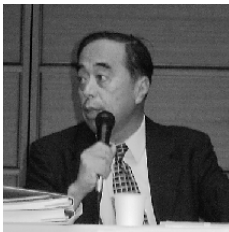
定 方 正 毅 〈SADAKATA, Masayoshi〉

西北大学卒，モスクワ大学大学院修了。アリゾナ大学水文学部，日本千葉大学環境リモート・センシングセンター客員教授などを歴任。中国科学院地理科学・資源研究所助手，助教授を経て，1985年より教授，1995年より中国科学院院士，1997年より北京師範大学資源・環境学院長兼任。現在，国際測地・地球物理学（IUGG）副委員長，国際地理学会（IGU）会長等務める。主な専門分野は水文学，自然地理学，地球科学。主な論文に South-to-North Water Transfer Schemes in China, International Journal of Water Resources Development , Vol. 18 (3), 2002; Freshwater Resources Management in China: Case Study of the Yellow River Basin, International Review for Environmental Strategies , Vol. 3 (2), 2002; Hydrological Cycle Changes in China's Large River Basin: The Yellow River Drained Dry, ed. By M. Beniston, Climatic Change: Implication for the Hydrological Cycle and for Water Management , 2002 などがある。