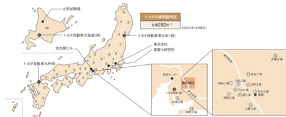
図3 トヨタ自動車の日本国内生産工場、研究開発機構と販売拠点

トヨタ会社の空間集結が体现しているだけでなく、海外に向けて拡張している。ホスト国でも、空間集結の方式で集中地域に集中している、自動車の部品と大量生産に集中が必要であるとともに、会社が地方に集中することで現地社会文化に溶け込みやすい、社会資本の融合とも密接に関連している。