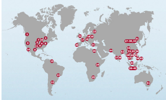
図2 トヨタ自動車の海外生産製造会社

160 カ国・地域に販売店も成立し、グローバル事業展開を行っている。トヨタ自動車の海外生産子会社は図2のように示されている 1) 。