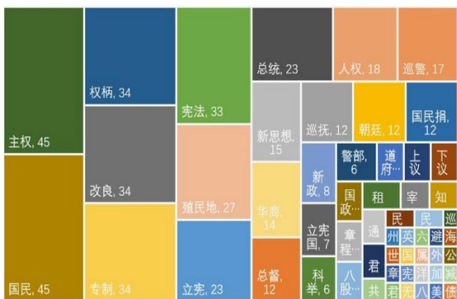
表 15 政治经济制度情感语境特征