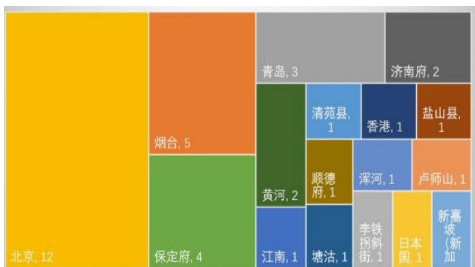
表 6 建筑词汇情感语境特征分析结果