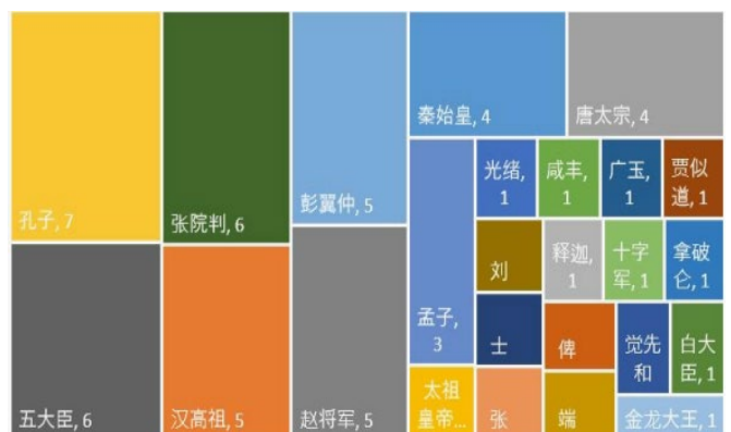
表 17 历史人物词语的词频呈现