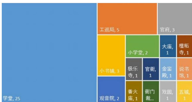
表 3 建筑词汇情感语境特征分析结果