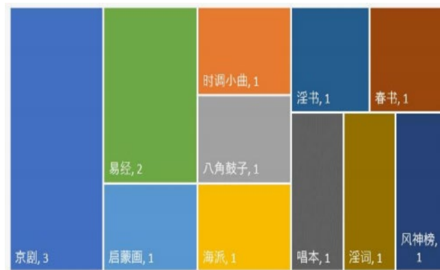
表 19 艺术和文学词语的词频呈现

由表 19 可知包含了不同类型的文化和学术领域的词汇。其中，京剧、易经出现次数较高，表明它在中国文化中具有较高的地位和影响力。此外，淫书、春书、唱本、淫词等词汇属于低俗文化范畴，反映出社会对于低俗文化的存在和接受。其他词汇如启蒙画、女学、格致学、万国史记等则表明了当时社会中对于教育、文化和学术的关注和重视。