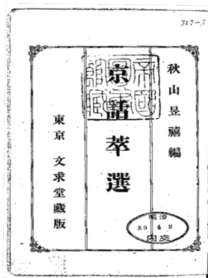
图 1 《京话萃选》封面

笔者先将《京话萃选》的文本特点进行了一定的考察，笔者先根据文章标题以及内容，以尤金·奈达文化分类体系中的语言文化、物质文化、社会文化为依据 [7] ，并结合本文文章的特性，将对《京话萃选》的五十篇文章进行了大致的分类与汇总，如图 2 所示。