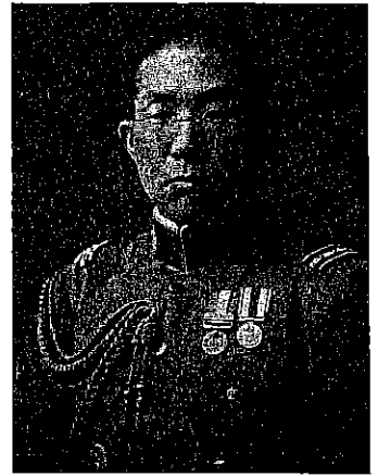
参謀本部作戦課勤務時代の遠藤三郎(30歳)

未公開の詳細な、80年にわたり書き継がれた「遠藤三郎日記」と本人の手元に残された旧関東軍の極秘資料や遠藤自身の手になる意見書、講授録(対ソ作戦案)、建白書等を博搜し、エリート軍人の、世界の完全軍縮構想にまで広がる、ドラスティックな思想転換の軌跡を明らかにする。